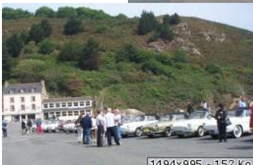
1494x995 - 152 Ko