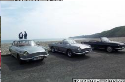
1494x995 - 106 Ko