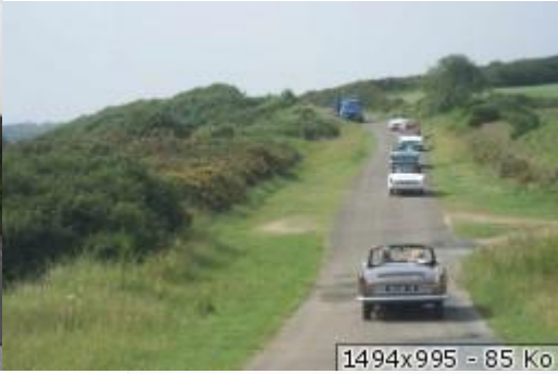
1494x995 - 85 Ko