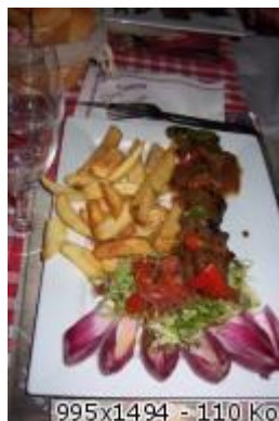
995x1494 - 110 Ko