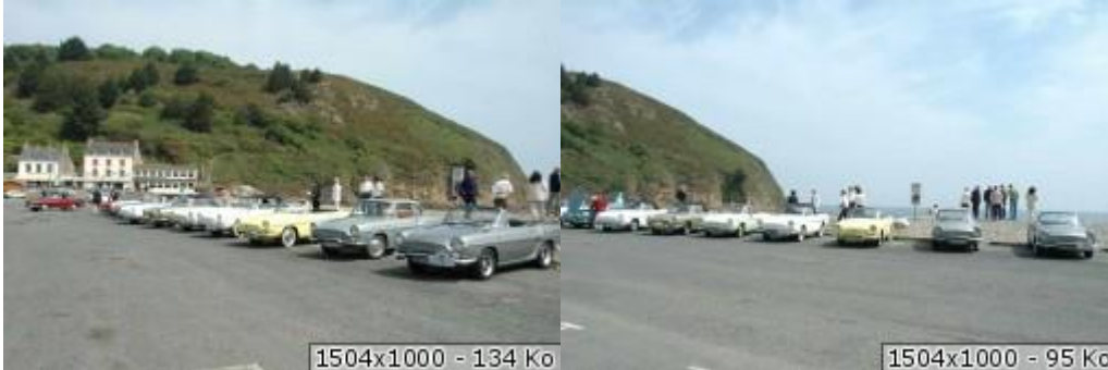
1504x1000 - 134 Ko