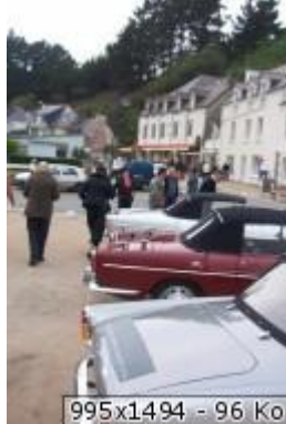
995x1494 - 96 Ko