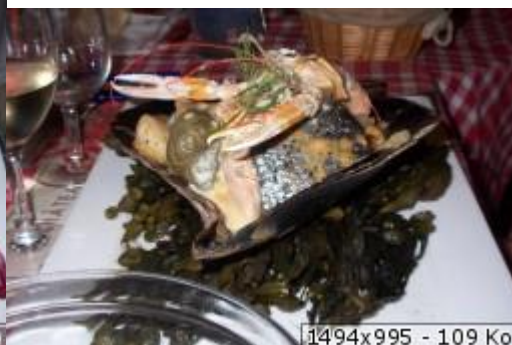
1494x995 - 109 Ko