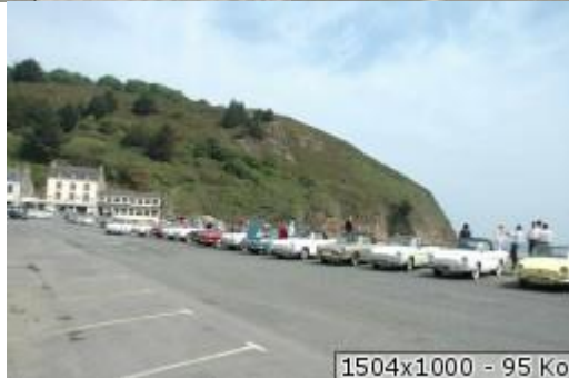
1504x1000 - 95 Ko