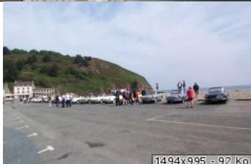
1494x995 - 92 Ko