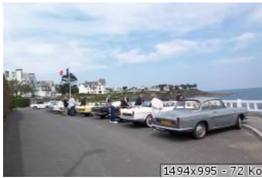
1494x995 - 72 Ko

Une petite pause au rond point pour permettre aux 27 voitures de se regrouper.