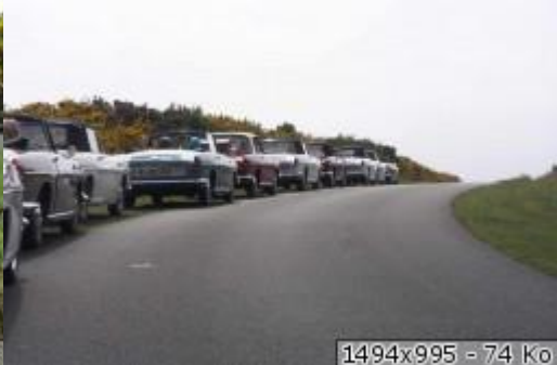
1494x995 - 74 Ko