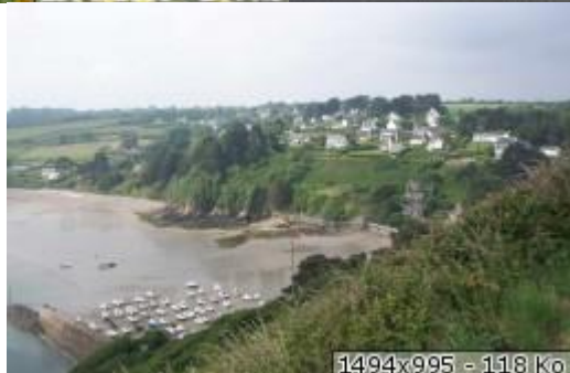
1494x995 - 118 Ko