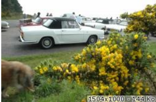
1504x1000 - 144 Ko