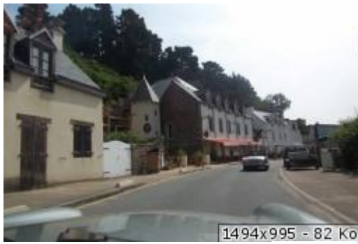
1494x995 - 82 Ko