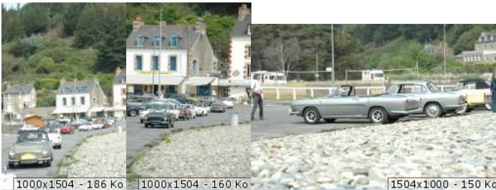
1000x1504 - 186 Ko