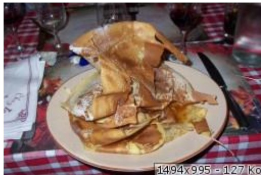
1494x995 - 127 Ko

Qui nous servent un repas des plus succulents