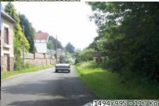
1494x995 - 117 Ko