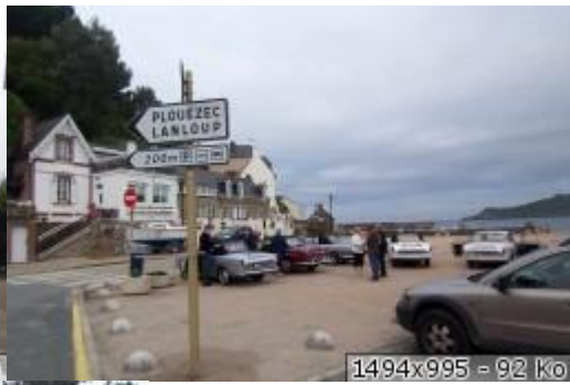
1494x995 - 92 Ko