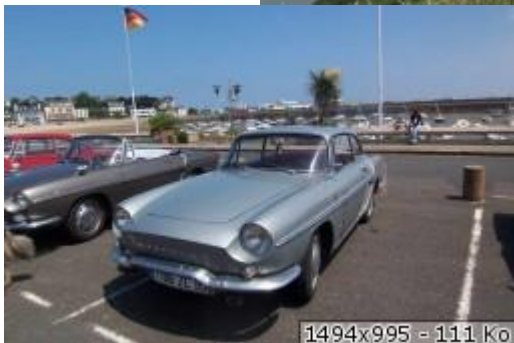
1494x995 - 111 Ko