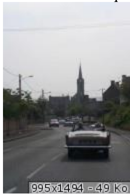
995x1494 - 49 Ko