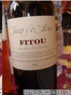
972x1296 - 91 Ko