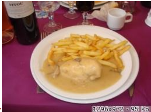
1296x972 - 95 Ko