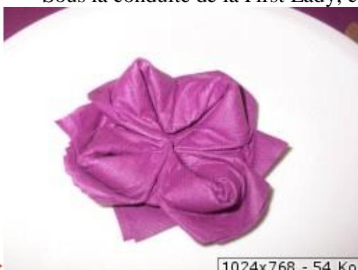
1024x768 - 54 Ko

Comme toujours dans les sorties du BFCC il y a la table des hommes et celle des dames Sous la conduite de la First Lady, ces dames se sont exercées à l'Origami