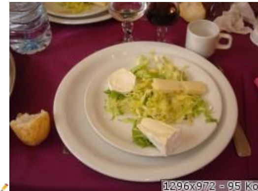
1296x972 - 95 Ko