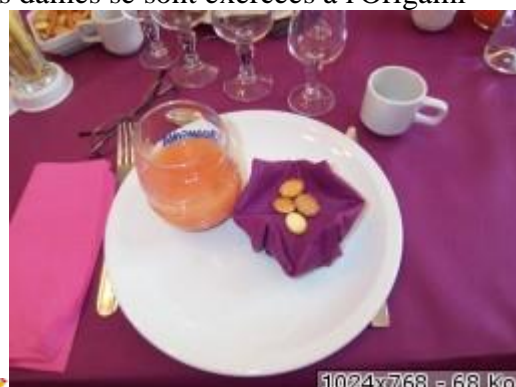
1024x768 - 68 Ko