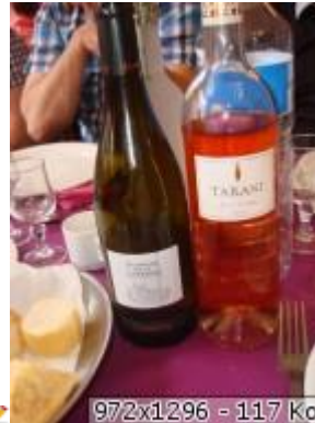
972x1296 - 117 Ko