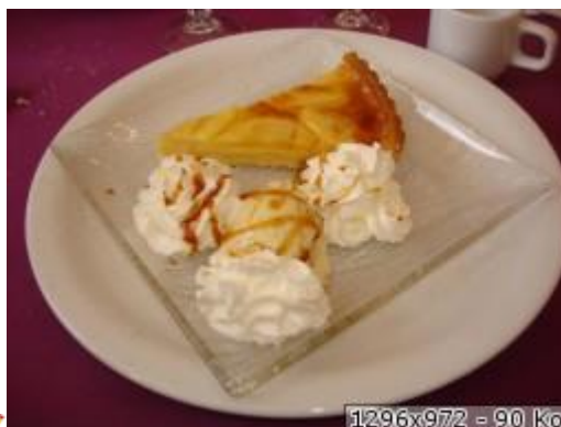
1296x972 - 90 Ko