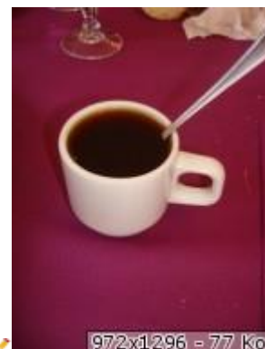
972x1296 - 77 Ko

Comme toujours dans les sorties du BFCC il y a la table des hommes et celle des dames Sous la conduite de la First Lady, ces dames se sont exercées à l'Origami