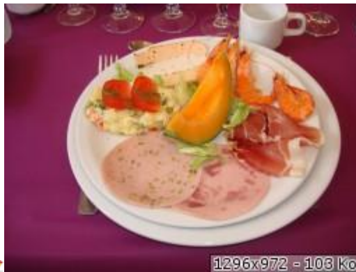
1296x972 - 103 Ko