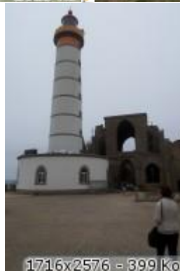
1716x2576 = 399 ko

avec au milieu un phare de 1835 enchâssé dans les ruines de l'abbaye bénédictine