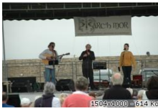
1504x1000 = 614 Ko