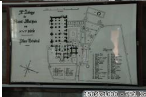
1504x1000 = 751 ko