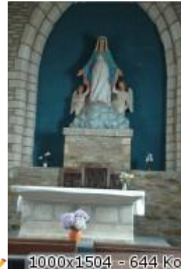
1000x1504 = 644 ko