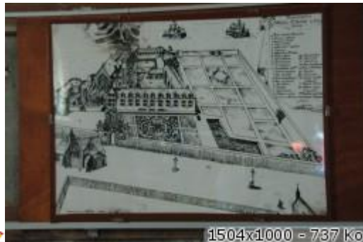
1504x1000 = 737 ko