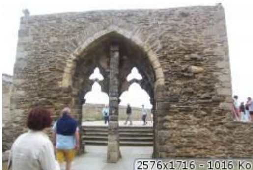
2576x1716 = 1016 Ko