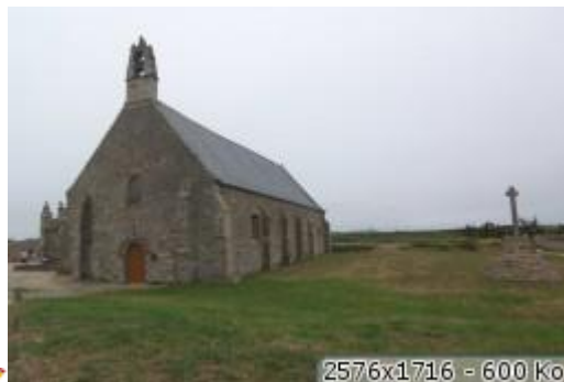
2576x1716 = 600 ko