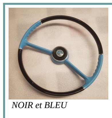
NOIR et BLEU